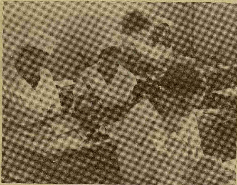
Студентки первого курса внимательны и сосредоточены. Первый зачет по теме «клетка», который кафедра общей биоло-

гии проводила с помощью электронных машин «Огонек», дал неплохие результаты.