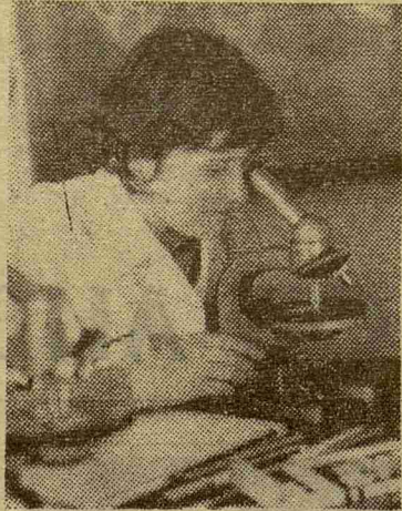
Первые шаги... Рисунок в альбоме (М. Левина, 158-я группа). Каков он, мир микрочастиц? (М. Виганд, 156-я группа).