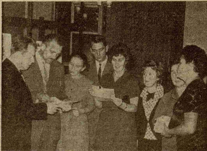
На снимке: выпускники 1951 года...

ОРГКОМИТЕТ ВСТРЕЧИ ВЫПУСКНИКОВ 1951 ГОДА