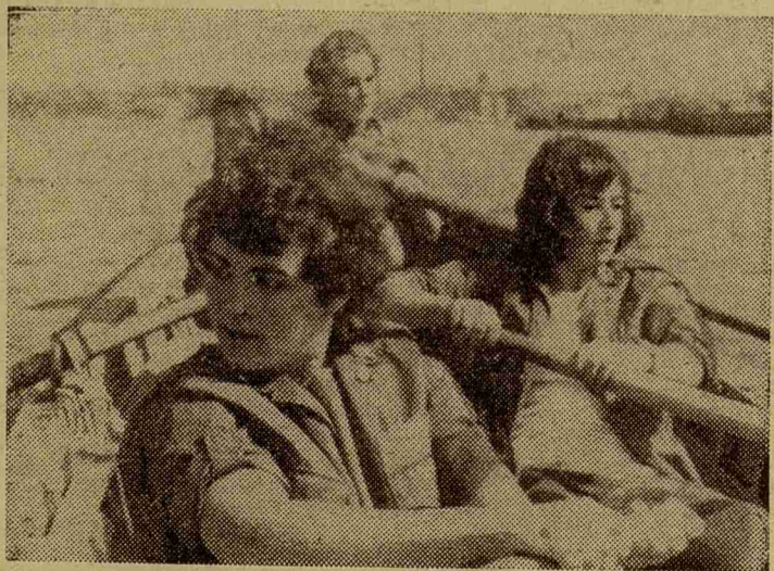
На снимке: женская команда ЛМИ на дистанции.