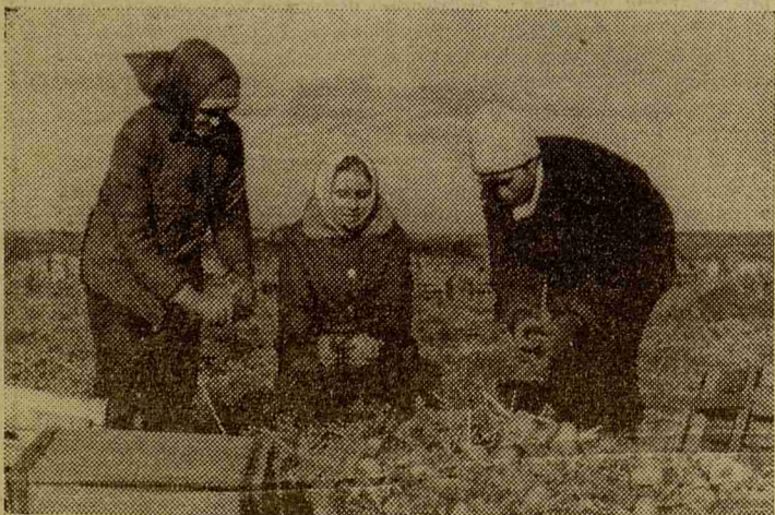
На снимке: второкурсники в «Федоровском».