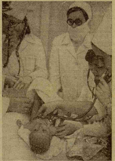
Как бьется твое сердечко, малыш?

Так, например, в поселке Жихарево практиканты столкнулись с вопиющей грубостью заведующей акушерским отделением районной больницы; она держала под страхом весь персонал и рожениц. Недовольная тем, что ее во внеурочное время вызвала к роженице, она могла оскорбить всех, пустить в ход нецензурные выражения, кричать на рожениц. Зная об этом, дежурный персонал всячески старался избежать ее