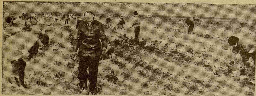
Так выглядят поля совхоза «Федоровское», на которых третью неделю работают студенты 1-го ЛМИ.