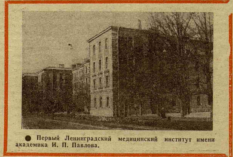
Первый Ленинградский медицинский институт имени академика И. П. Павлова.

Профессия врача очень почетна, но и очень ответственна. Освоить специальность нелегко — нужно много и упорно трудиться. Только тогда можно стать хорошим, высококвалифицированным