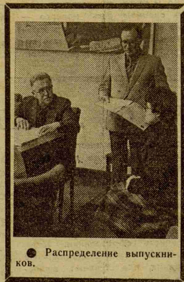
● Распределение выпускников.