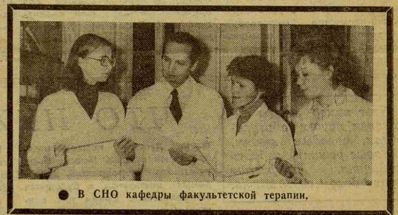
● В СНО кафедры факультетской терапии.