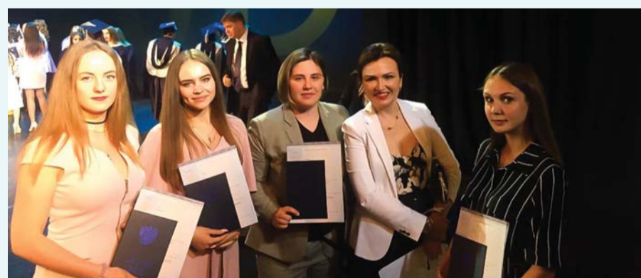
Выпускники отделения адаптивной физической культуры, 2020 год

Основано в 2005 году. Осуществляет подготовку бакалавров по специальности «Физическая культура для лиц с отклонениями в состоянии здоровья (адаптивная физическая культура)». Форма обучения – заочная, продолжительность обучения – 5 лет. С третьего курса студенты овладевают знаниями по специализации «Физическая реабилитация». Производственная практика проходит на базе общеобразовательных учреждений, реабилитационных и медико-социальных центров, стационаров и поликлиник.