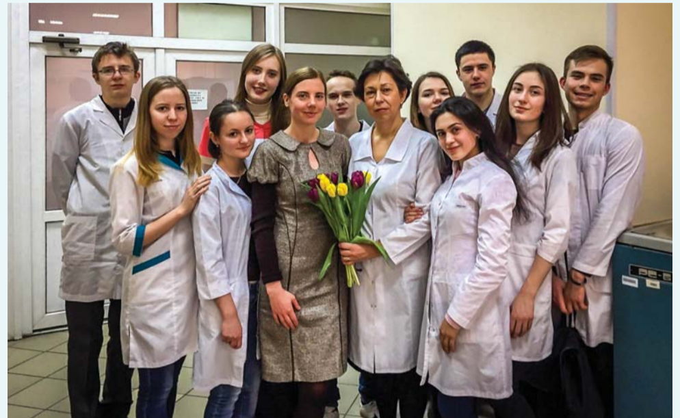
Выпускники стоматологического факультета, 2020 год

Практические занятия проводятся как на собственной клинической базе Университета (в том числе, на базе Научно-исследовательского института стоматологии и челюстно-лицевой хирургии – самого большого учебного стоматологического центра Северо-Западного региона России), так и на базах 30 городских государственных и негосударственных стоматологических ЛПУ.