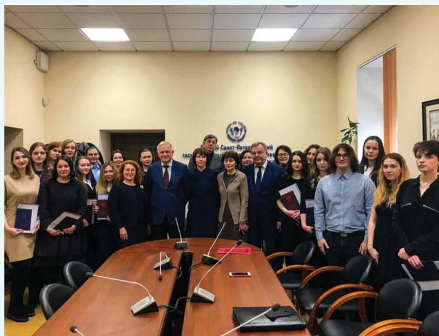
Выпускники отделения клинической психологии, 2020 год

– Возможности медицинского Университета для подготовки клинического психолога оптимальны. Сочетание глубоких знаний психологии и медицины делает наших выпускников уникальными и очень востребованными специалистами.