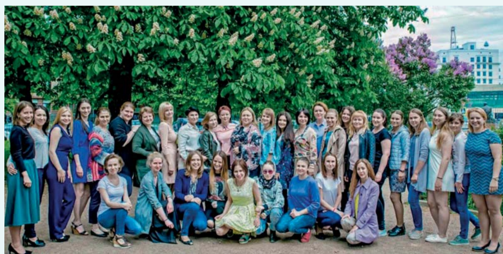
Выпускники Института сестринского образования, 2018