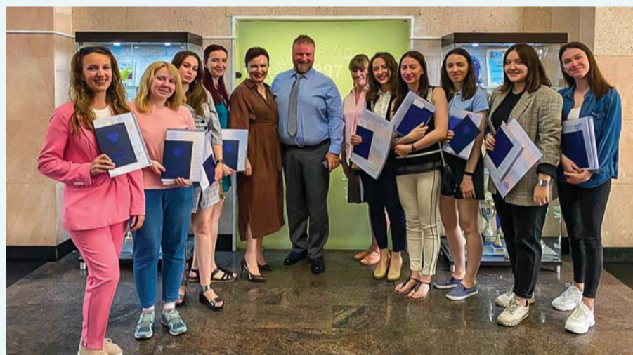
Выпускники педиатрического факультета, 2020 год

Производственная практика проходит на ведущих базах Университета – в ДГБ № 1 и НИИ детской онкологии, гематологии и трансплантологии имени Р.М. Горбачевой, перинатальном центре Северо-Западного федерального медицинского исследовательского центра имени В.А. Алмазова. Выпускники педиатрического факультета могут продолжить свое обучение в клинической ординатуре и аспирантуре более чем по двадцати медицинским специальностям.