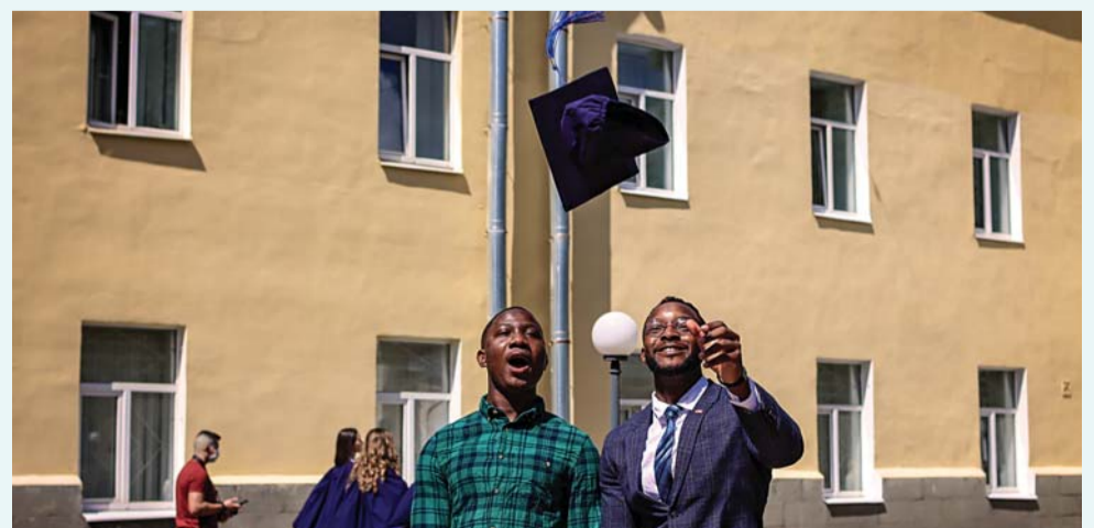
Выпускники медицинского факультета иностранных студентов, 2020 год

За более чем сто лет количество наших выпускников превысило 5 тысяч. Среди них – граждане Бразилии, Великобритании, Швеции, Финляндии, Греции, Израиля, Индии, Ирана, Канады, КНР, Кувейта, Ливана, Марокко, США и других стран. Высокое качество обучения дает им возможность добиваться хороших результатов в профессии.