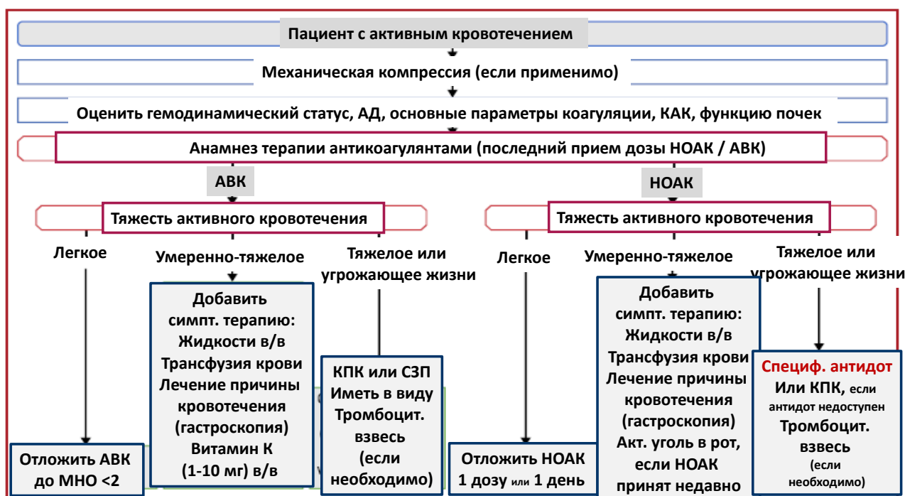
Рис. 5. Тактика ведения пациентов, получающих антикоагулянты, на фоне кровотечения [1] КАК – клинический анализ крови; КПК – концентрат протромбинового комплекса; СЗП – свежзамороженная плазма

На рис. 5 представлен алгоритм действий при кровотечениях на фоне применения антикоагулянтов.