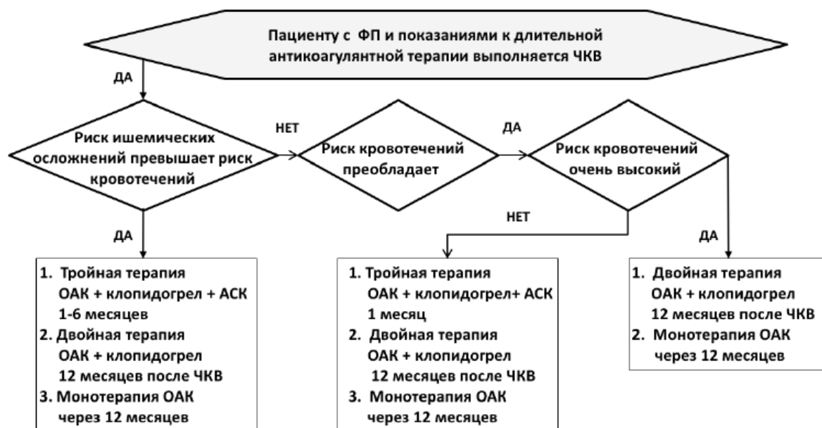
Рис. 4. Алгоритм выбора режима антитромботической терапии после ЧКВ у пациентов с ФП и показаниями к длительной антикоагулянтной терапии. [3]