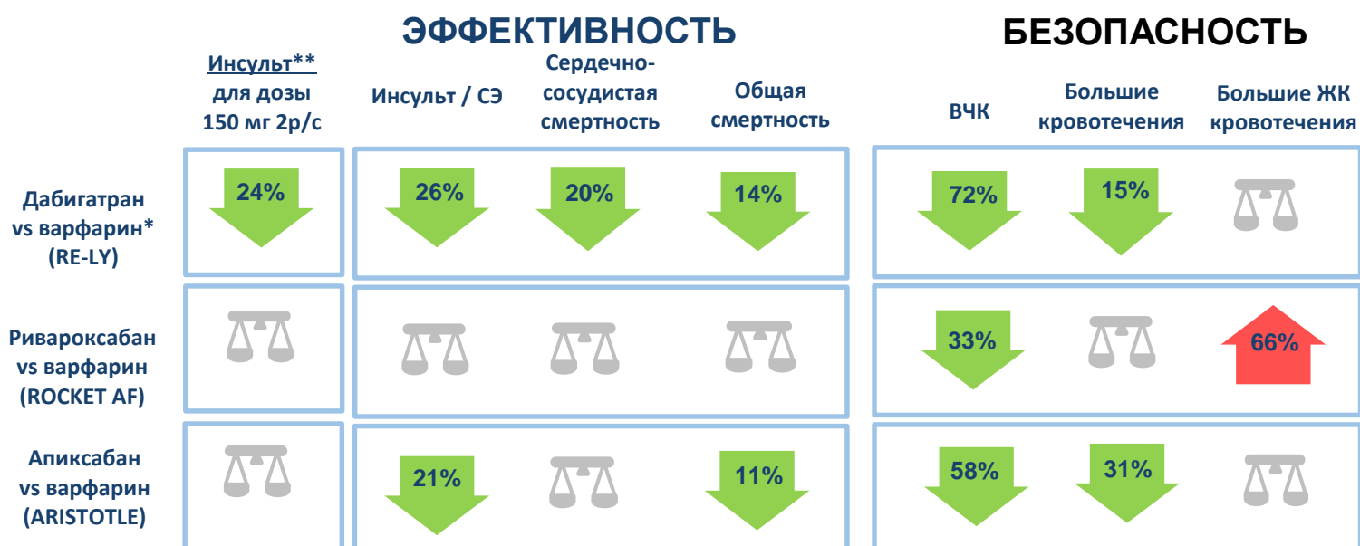
Рис. 3. Сопоставление эффективности и безопасности НОАК, назначенных в соответствии с европейской инструкцией, с варфарином в рандомизированных клинических исследованиях

Рандомизированные клинические исследования по прямому сопоставлению НОАК не проводились, но эффективность каждого из НОАК в РКИ была сопоставлена с варфарином. Основные данные этих сопоставлений с варфарином представлены на рисунке 3.