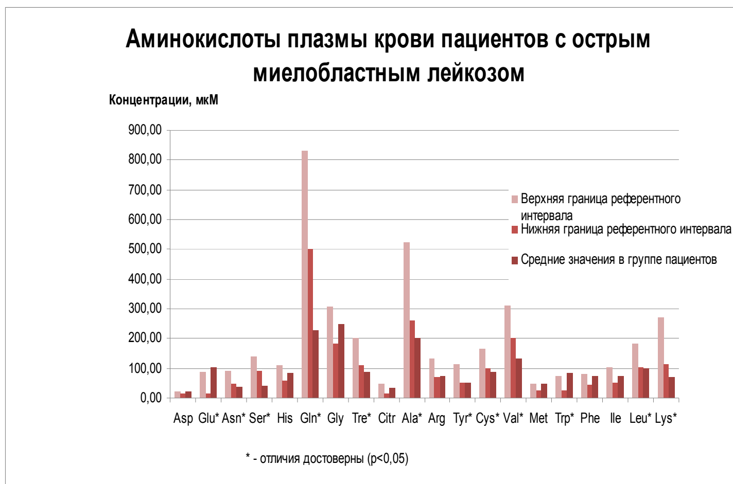
Рис. 1. Аминокислоты плазмы крови пациентов с острым миелобластным лейкозом

Результаты исследования и их обсуждение. Исходный аминокислотный профиль пациентов в сопоставлении с известными из литературы референтными значениями [10, 11] характеризовался выраженным дисбалансом (рис.1).