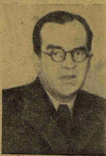
Проф. В. Г. Гаршин

Проводится подписка на газету «Пульс» на 1948 год. Стоимость подписки 40 коп. в месяц, за полгода — 2 р. 40 коп. Подписка принимается уполномоченными на курсах, кафедрах, в клиниках.