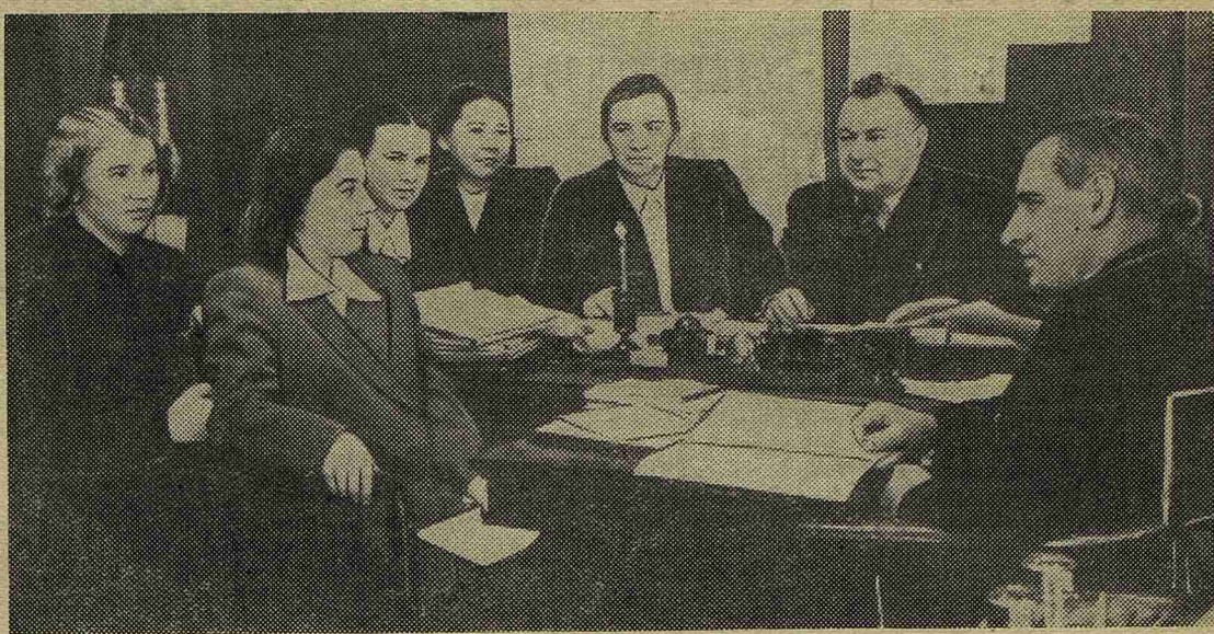
Первый день распределения

9 апреля началось распределение студентов VI курса. В первый день направления на места работы получали терапевты, акушеры-гинекологи, психиатры, дермато-венерологи и окулисты.