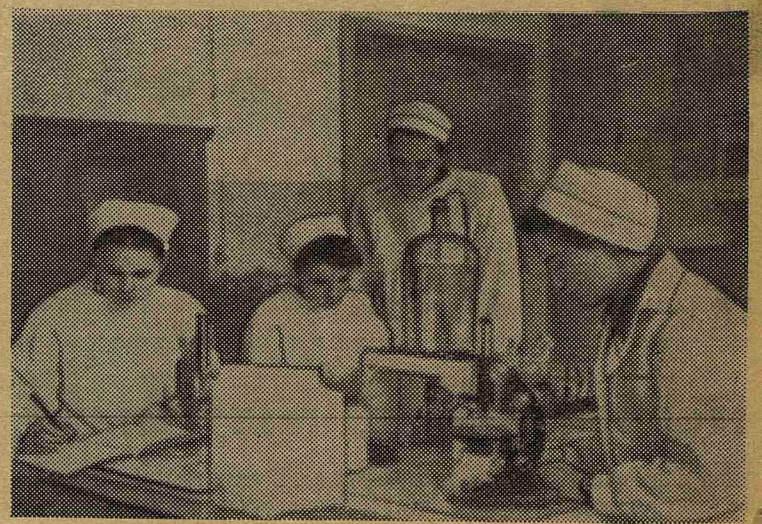
Интересно проходят практические занятия на кафедре микробиологии. На снимке: студенты 336-й группы на практическом занятии по теме: «Бактерии кишечной группы».