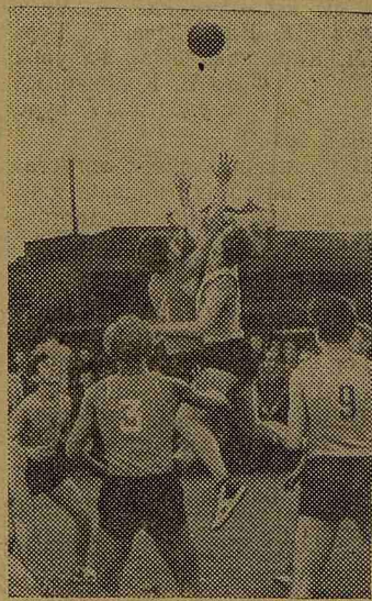
На снимке: в дни спартакиады. Встреча мужской баскетбольной команды нашего института с саратовскими студентами. Игра закончилась победой I ЛМИ.

Много огорчений доставили болельщикам волейболисты. Они порой проигрывали встречу, которая всем казалась уже выигранной. Так получилось в