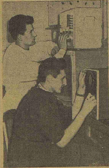
представил большую сводку литературных данных о химии и фармакологии новой группы веществ, угнетающих деятельность вставочных нейронов. Сообщение Грантынь вызвало большой интерес у делегатов конференции и было удостоено денежной премии.