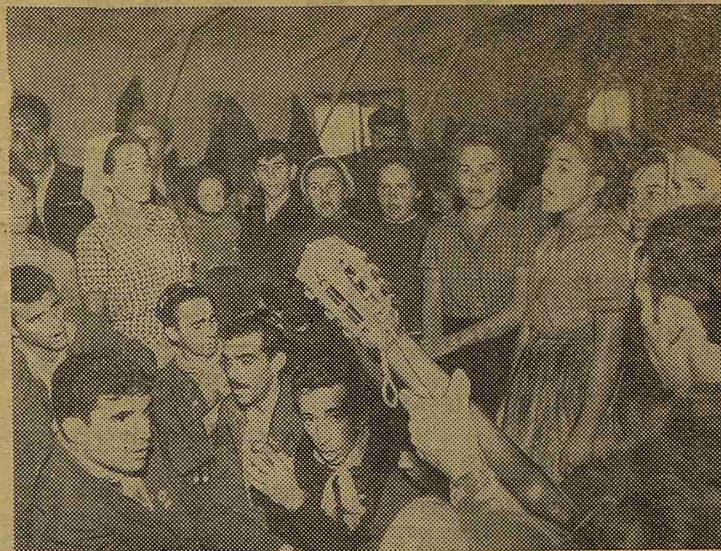
После окончания работы VII конгресса МСС на целину, в совхоз «Раздольный», приехала кубинская делегация. На снимке: кубинцы в гостях у отряда ЛИСИ — ЛМИ.

Кокчетав! Наша конечная остановка. Здесь нас «разобрали по частям». Каждый отряд получил своего медика, и отторгнутый элмэшиник грустно смотрел на оставшихся собратьев. Впереди три месяца будней, три месяца стройки, «сухого закона» и мужества. Теперь каждый предоставлен себе, своей совести и убеждениям. Нет коллектива 1-го ЛМИ, но есть его частицы — ребята, несущие с собой жар молодых сердец и верность своему делу.