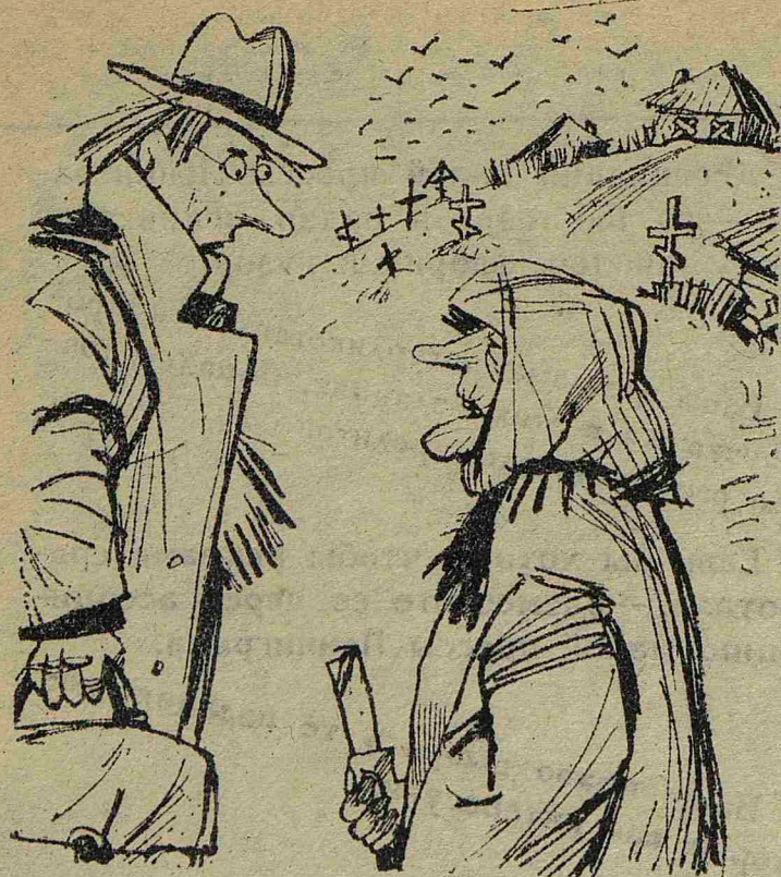
— Здесь что-нибудь про СПИД слышали? — Уже переболели, батюшка.