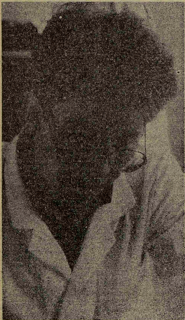
Студент пятого курса перед сдачей истории по инфекционным болезням:

Кто и как питается в этой столовой и почему такие цены, — об этом читайте в следующем номере «Пульса».