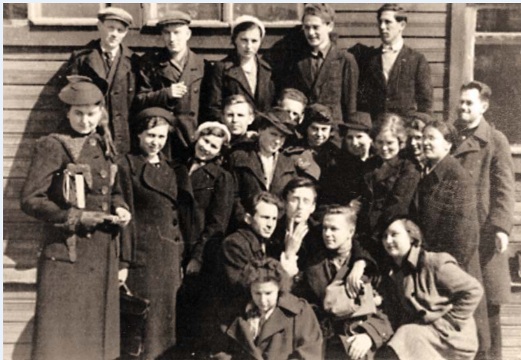
1941 год. 1 ЛМИ. III курс

1941 год, июнь. Окончила третий курс, оставалось лишь сдать последний экзамен – он был назначен на 23 июня, но накануне началась