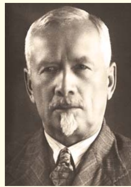
Академик АМН СССР М.В. Черноурцкий Кафедра госпитальной терапии