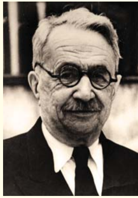
Академик АМН СССР М.Д. Тушинский Кафедра пропедевтики внутренних болезней