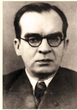
Академик АМН СССР В.Г. Гаршин Кафедра патологической анатомии