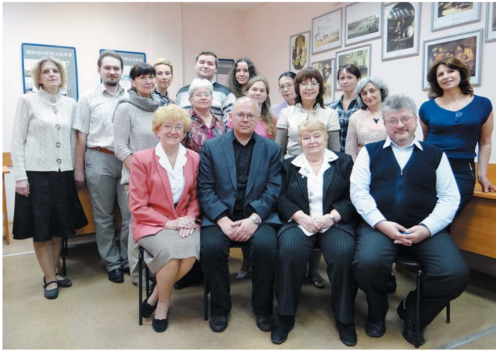
Коллектив кафедры истории Отечества сегодня

Так говорили древние мыслители о роли и значении изучения истории, а всем известный русский деятель Н.Г. Чернышевский отмечал: можно не знать множества наук и всё-таки быть образованным человеком, но «...не знать и не любить историю может человек, совершенно ограниченный умственно!»