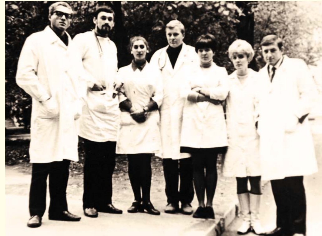
Фото из выпускного альбома 1972 года

1 ЛМИ им. И.П. Павлова на низкий конкурс никогда не жаловался, а в тот год тем более. Напряженная, а не расслабленная летняя обстановка царит на участке Петроградского района, ограниченном, с одной стороны, мутной рекой Карповкой, а с трех других сторон – шумными от трамвайного ляга улицами Петропавловской, Льва Толстого и Скороходова. На зеленой от деревьев и кустарников территории института