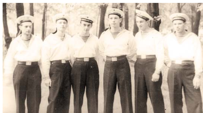
Будущие офицеры военно-морского флота перед отправкой на корабли, 1959 год