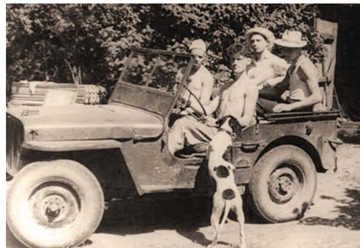
После лодочного похода в Переяславле-Залесском