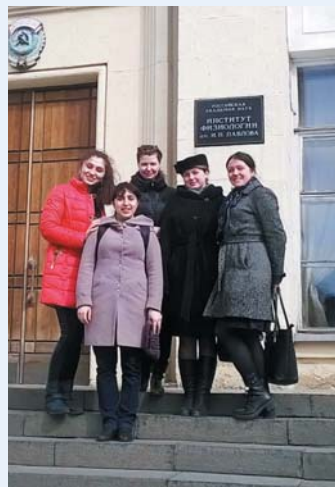
Студенты ПСПбГМУ на экскурсии