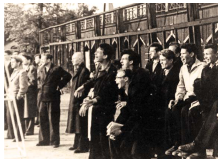
Фотографии из выпускного альбома 1960 года