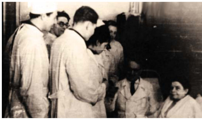
Фото из выпускного альбома 1960 года