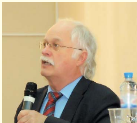
Профессор Удо Йонас (Германия)