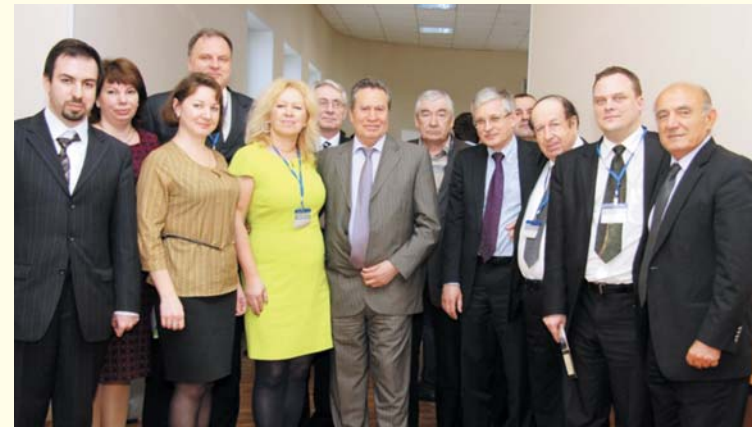
В кулуарах конференции