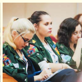
Наши студенты на слете студенческих отрядов