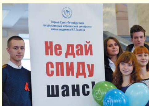
Акция, посвященная Дню борьбы со СПИДом