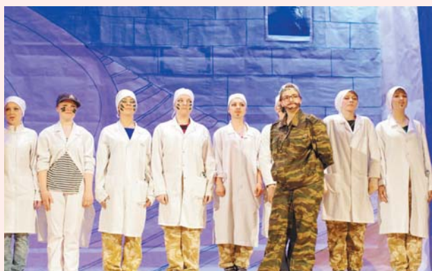
Конкурс Мисс 1мед

Умеете не только веселиться сами, но и заставлять смеяться других? Тогда ваше место в «капустной команде»! Шутки, песни, пьесы, танцы – каждый найдет способ проявить свое творческое «Я». «Капустная» сцена свято хранит чистоту юмора, не загрязняя его текстами низкого качества. Только отборные шутки, только оригинальные песни. Эти представления приятно смотреть, этим позитивом полезно заряжаться, ведь смех, как известно, продлевает жизнь. Капустник – сугубо авторское творчество: команда сама, на протяжении долгого времени, по крупицам собирает вечер, чтобы превратить его в насыщенное, искрометное зрелище. Капустники проводятся весной – в апреле и мае, участвуют в них команды всех курсов.