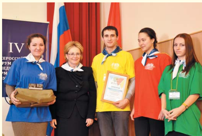
Всероссийский форум студентов медицинских и фармацевтических вузов. Наши студенты с министром здравоохранения Р.Ф. В.И. Скворцовой

Совсем необязательно быть членом какой-либо организации, чтобы иметь возможность проявить себя. Достаточно обладать желанием. Студенческие годы прекрасны: это время веселых историй, удивительных открытий и ваших первых достижений.