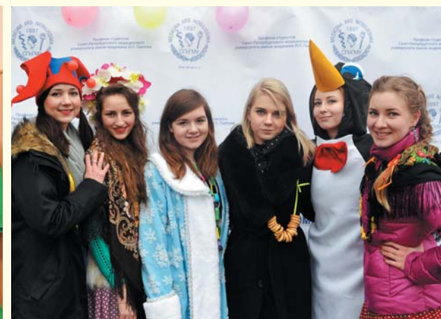
Праздник Масленицы, организованный студентами