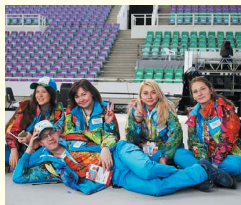
Наш студент – волонтер Олимпиады в Сочи 2014