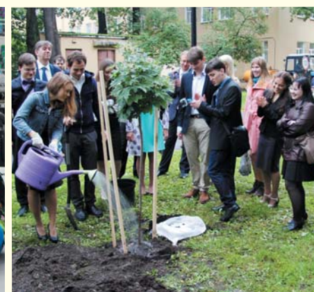
Ежегодная посадка деревьев на Аллее выпускников Университета

Подписывайтесь на наш Instagram ( http://instagram.com/1spbkgmu ) и группу «ВКонтакте» ( http://vk.com/1spbkgmuofficial )