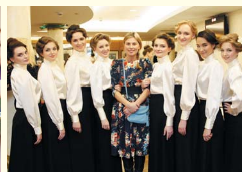
Праздничное мероприятие, посвященное дню рождения Университета