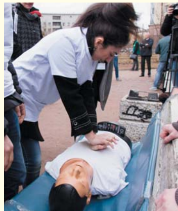
Акция «Демонстрация основ неотложной помощи» в рамках Всероссийского форума студентов медицинских и фармацевтических вузов