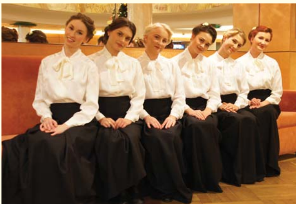
Во время празднования 115-летия со дня основания Университета

Совсем не обязательно быть членом какой-либо организации, чтобы иметь возможность проявить себя. Достаточно обладать желанием. Студенческие годы прекрасны: это время веселых историй, удивительных открытий и ваших первых достижений.