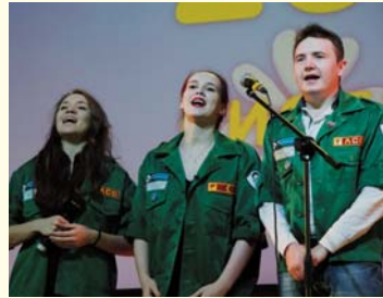
Празднование 20-летия студенческого медицинского отряда «Диоген»