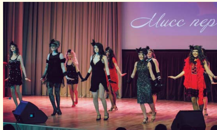
Участницы конкурса «Мисс Первый мед»