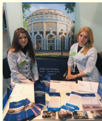
Выставка «Образование и карьера XXI век»