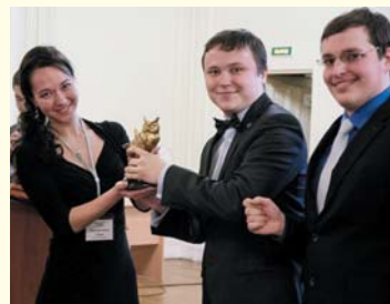
Студенческий чемпионат по интеллектуальным играм «Что? Где? Когда?»