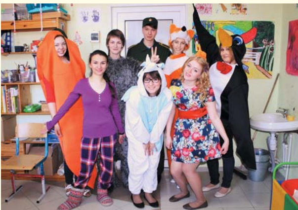
Благотворительная акция «Урок добра» в Павловском детском доме