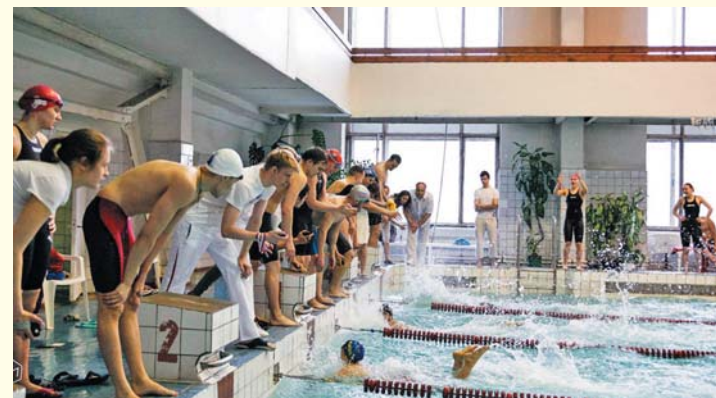
На «Фестивале спорта» в 2016 году