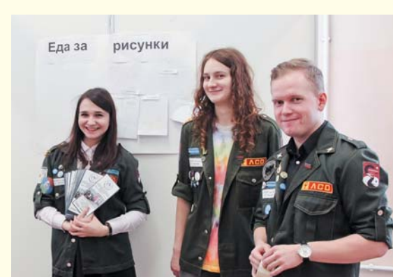
Наши студенты на Дне российских студенческих отрядов, 2017 год