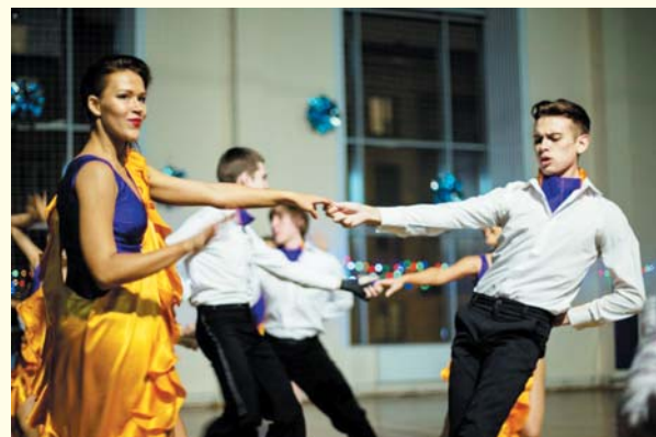
Фестиваль «Танцевальная зима», 2016 год