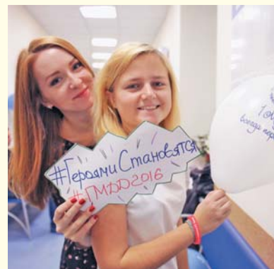
День донора в отделении переливания крови Университета, 2016 год