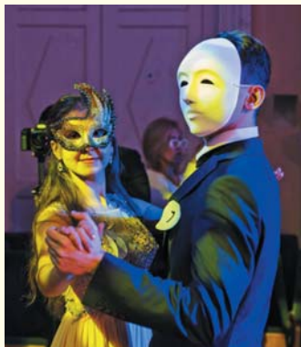
Бал Первого СПбГМУ им. акад. И.П. Павлова, 2016 год

Совсем не обязательно быть членом какой-либо организации, чтобы иметь возможность проявить себя. Достаточно обладать желанием. Студенческие годы прекрасны: это время веселых историй, удивительных открытий и ваших первых достижений.