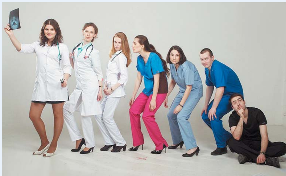
Выпускники лечебного факультета, 2014 год

Основан в 1897 году. Осуществляет подготовку врачей-лечебников по специальности «Лечебное дело». Среди особенностей учебного плана можно выделить глубокое изучение медико-биологических дисциплин и большой объем общеклинической подготовки студентов. На кафедрах факультета имеется более 200 учебных комнат, 39 научных и учебных лабораторий – учебных музеев; лекции читаются в 12 аудиториях, оборудованных современными видами наглядной демонстрации материала. Большая часть клинических практических занятий проводится на собственной клинической базе Университета (более 1500 коек), а также на базах поликлиник, крупных городских стационаров (многопрофильные больницы № 2, № 3 им. святой Великомученицы Елизаветы, № 4 им. святого Великомученика Георгия, № 17 – Александровская больница, инфекционная больница им. С.П. Боткина, детская больница № 1, инфекционная детская больница № 5 и многие другие), а также на базах различных научных центров (Северо-Западный федеральный медицинский исследовательский центр им. В.А. Алмазова, Научно-исследовательский психоневрологический институт им. В.М. Бехтерева, Институт мозга человека РАН, НИИ онкологии им. Н.Н. Петрова и др.).