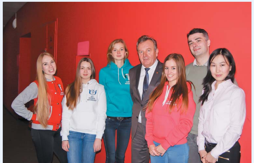
Первые выпускники отделения клинической психологии с куратором, 2017 год

– Возможности медицинского Университета для подготовки клинического психолога оптимальны. Сочетание глубоких знаний психологии и медицины сделает наших выпускников уникальными и очень востребованными специалистами.