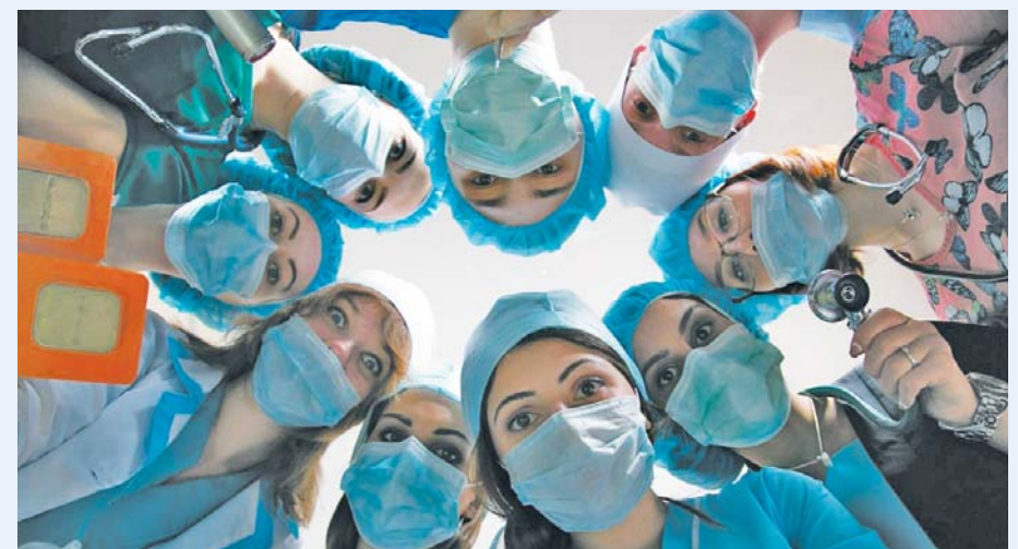
Выпускники педиатрического факультета, 2016 год

Производственная практика проходит на ведущих базах Университета – в ДГБ № 1 и НИИ детской онкологии, гематологии и трансплантологии имени Р.М. Горбачевой, перинатальном центре Северо-Западного федерального медицинского исследовательского центра имени В.А. Алмазова. Выпускники педиатрического факультета могут продолжить свое обучение в клинической ординатуре и аспирантуре более чем по двадцати медицинским специальностям.