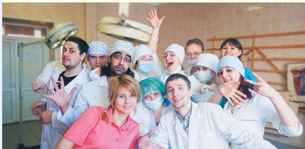
Выпускники стоматологического факультета, 2013 год

– Наш факультет знаменит уникальной концепцией подготовки специалиста-стоматолога, в основе которой лежит принцип лечения не болезни, а больного. Недаром на факультете существуют свои кафедры внутренних и хирургических болезней. Факультет известен своим профессорско-преподавательским составом не только в России, но и за ее пределами. И, безусловно, мы гордимся своими выпускниками!