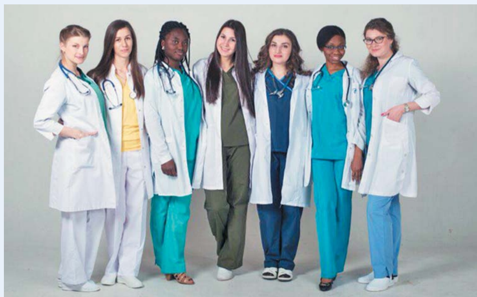
Выпускники медицинского факультета иностранных студентов, 2016 год

За все время существования Университета на различных его факультетах обучалось более 5 тысяч граждан других стран. В настоящее время обучение проходят студенты из 74 стран. В качестве структурного подразделения факультет существует с 1961 года. Осуществляются довузовская подготовка, додипломное образование (по специальностям «Лечебное дело», «Стоматология», «Педиатрия»), различные формы последипломного и дополнительного образования, включая клиническую ординатуру, аспирантуру и докторантуру. На факультете организовано сопровождение студентов в вопросах, связанных с размещением в общежитии, соблюдением режима пребывания в России, организацией досуга и внеучебной работы. В настоящее время многие иностранные выпускники работают в США, Канаде, странах Европы, Африки и Азии. Некоторые являются ведущими специалистами в своей области.