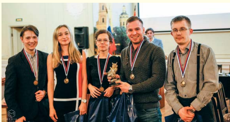
Студенческий чемпионат по интеллектуальным играм «Что? Где? Когда?», 2016 год