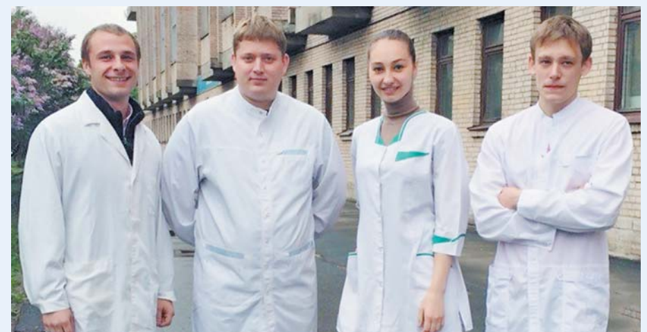
Выпускники факультета адаптивной физической культуры, 2014 год

Основан в 2005 году. Осуществляет подготовку бакалавров по специальности «Физическая культура для лиц с отклонениями в состоянии здоровья (адаптивная физическая культура)». Форма обучения – заочная, продолжительность обучения – 5 лет. С третьего курса студенты овладевают знаниями по специализации «Физическая реабилитация». Производственная практика проходит на базе общеобразовательных учреждений, реабилитационных и медико-социальных центров, стационаров и поликлиник.