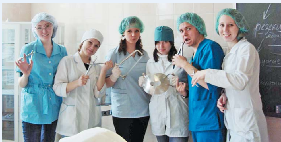
Выпускники отделения спортивной медицины, 2013 год

Основано в 1991 году. Осуществляет подготовку врачей по специальности «Лечебное дело». С третьего курса студенты овладевают знаниями по лечебной физической культуре, спортивной медицине, медицинскому массажу, физиотерапии. Специализированные предметы изучаются на базах врачебно-физкультурных диспансеров, научно-исследовательских институтов.