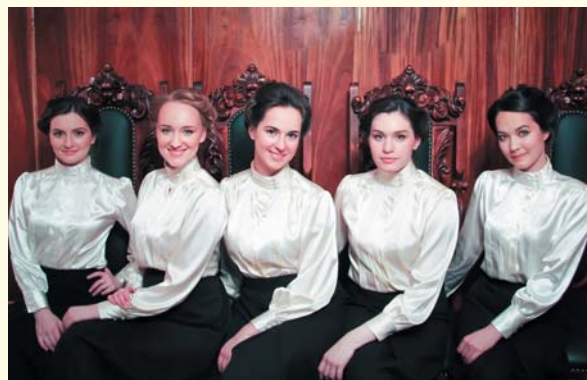
Наши студентки в роли первых слушательниц медицинского института начала XX века, день рождения Университета, 2016 год