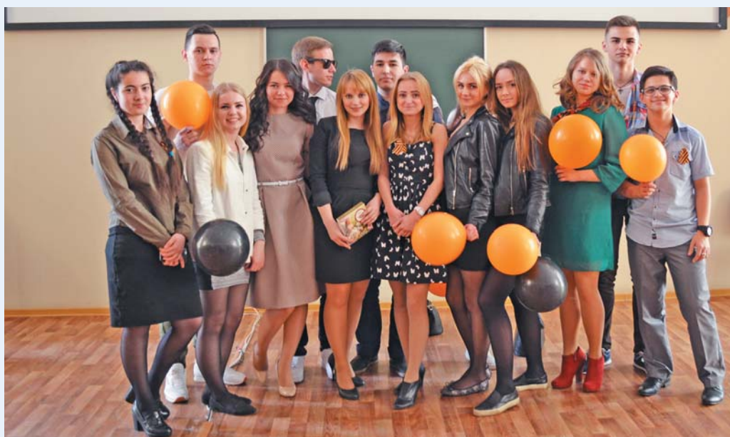
Выпускники института сестринского образования, 2016 год