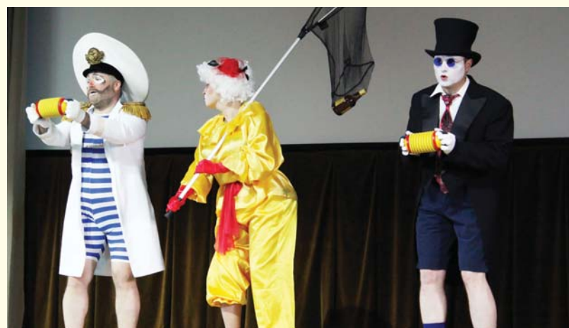
Конкурс "Алло, мы ищем таланты", 2014 год

ул. Большая Монетная, дом 19, Концертный зал Администрации Петроградского района. Начало в 17:00.