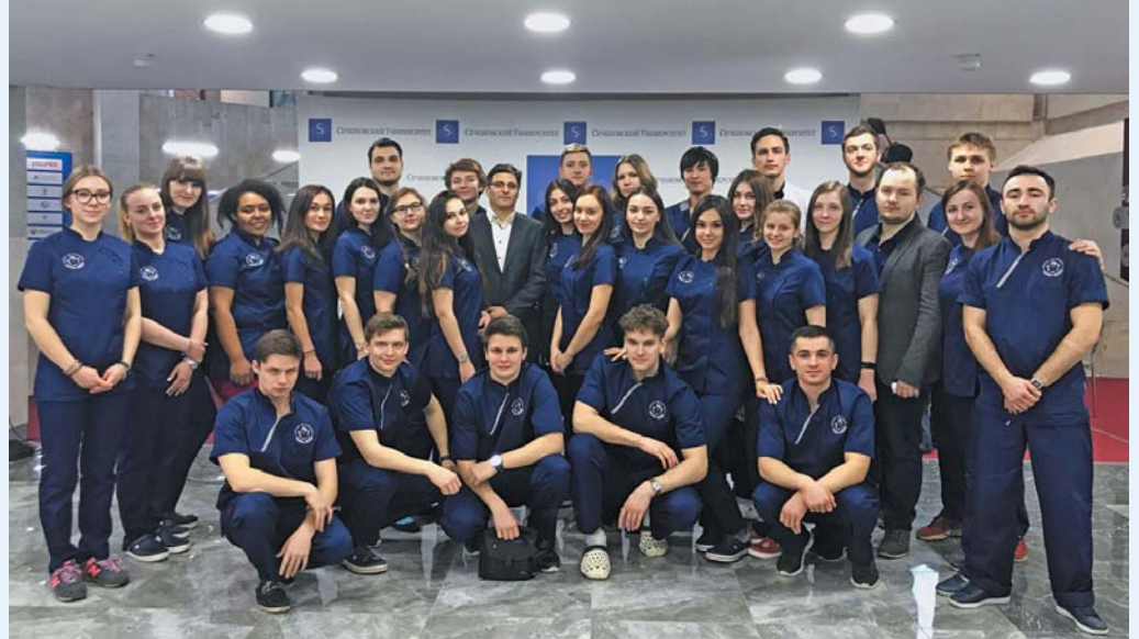
В этом году олимпиада включала в себя 19 различных конкурсов