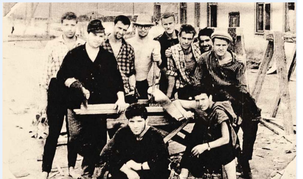
Фото из архивов выпускников стоматологического факультета 1967 года