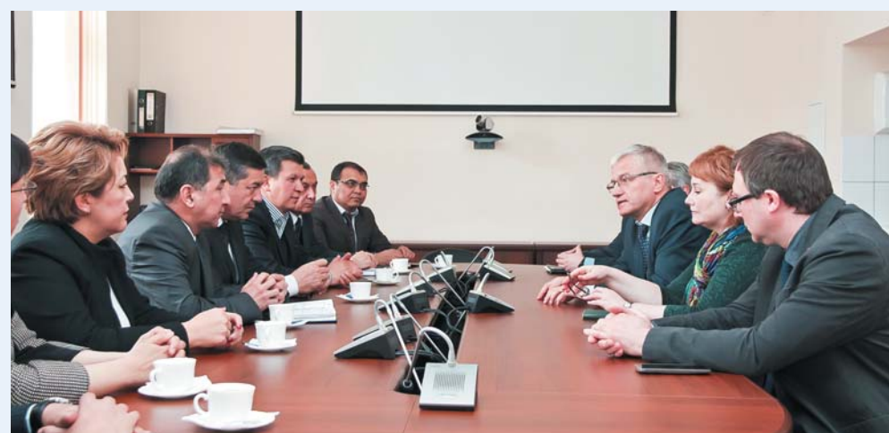
Встречи проходили в зале заседаний ректората № 1

Узбекская сторона выразила большую заинтересованность в дальнейшем сотрудничестве и пригласила представителей администрации Первого СПбГМУ на открытие нового медицинского центра на базе Ургенчского филиала Ташкентской медицинской академии в мае 2017 года.