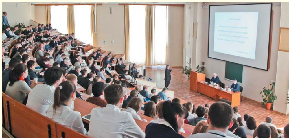
Интерес к научной программе конференции был такой, что аудитория № 1, где проходили заседания, на многих из них не могла вместить всех желающих

20 и 21 апреля в Университете проходила 3-я ежегодная научно-практическая конференция урологов Северо-Западного федерального округа.