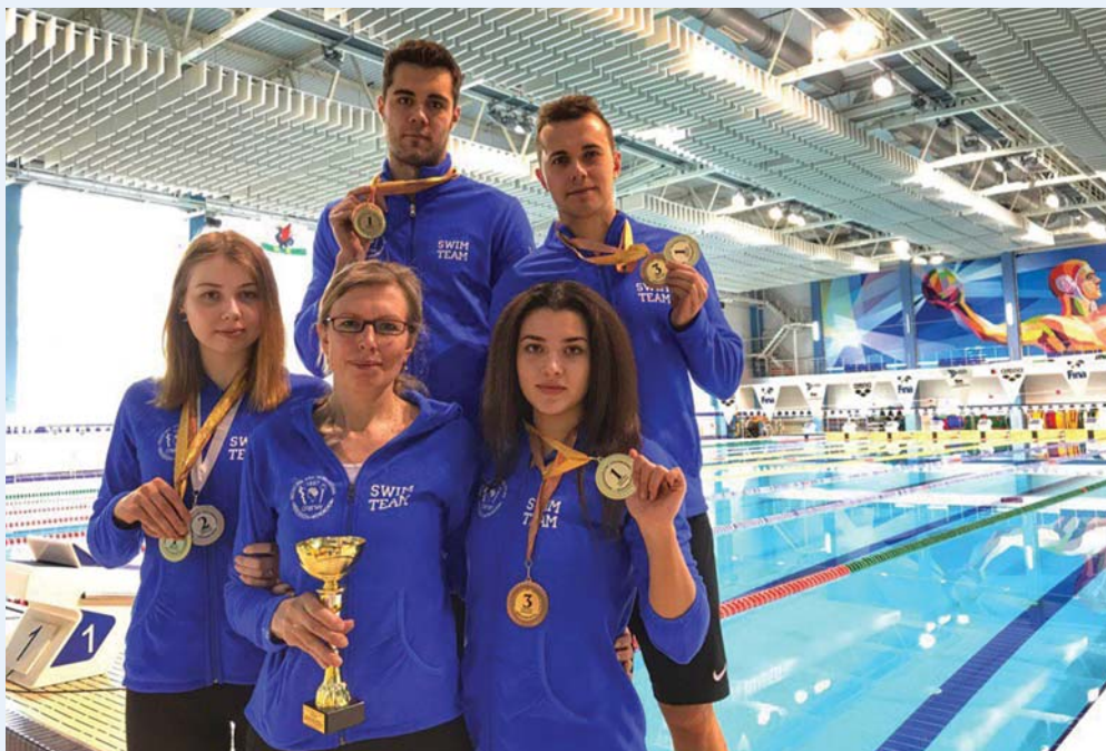
Сборная Университета по плаванию на Фестивале спорта в Казани

Нынешний апрель был богат на победы, причем в самых разных направлениях внеучебной деятельности и на самом разном уровне – от университетского до всероссийского.