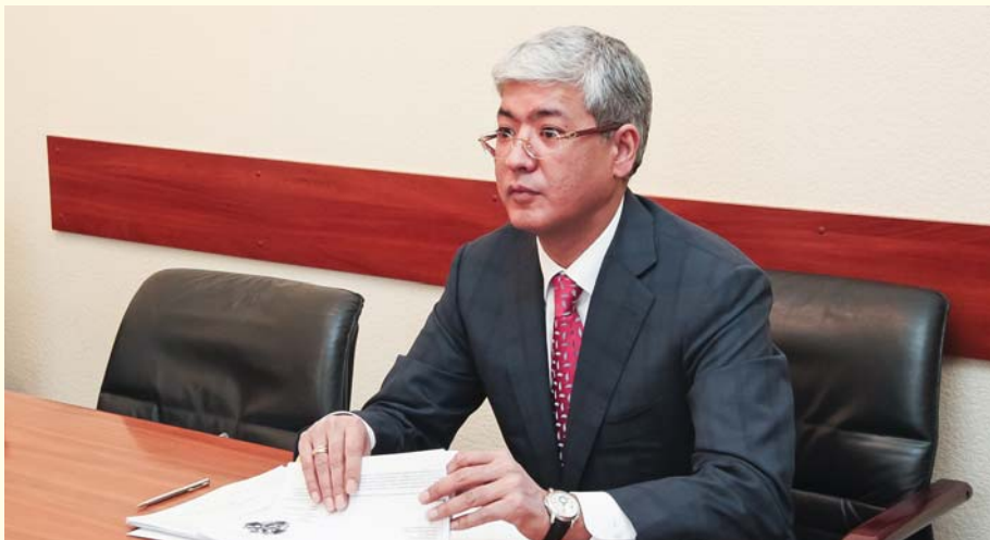
Генеральный консул Республики Казахстан в Санкт-Петербурге Е.С. Примбетов

24 апреля Университет посетил генеральный консул Республики Казахстан в Санкт-Петербурге Е.С. Примбетов.