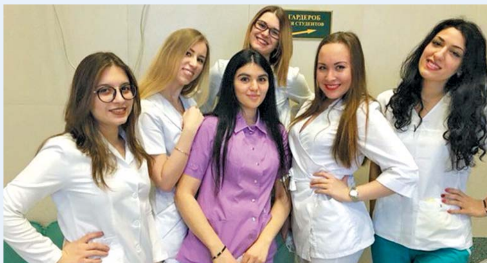
Выпускники стоматологического факультета, 2016 год

– Наш факультет знаменит уникальной концепцией подготовки специалиста-стоматолога, в основе которой лежит принцип лечения не болезни, а больного. Недаром на факультете существуют свои кафедры внутренних и хирургических болезней. Факультет известен своим профессорско-преподавательским составом не только в России, но и за ее пределами. И, безусловно, мы гордимся своими выпускниками!