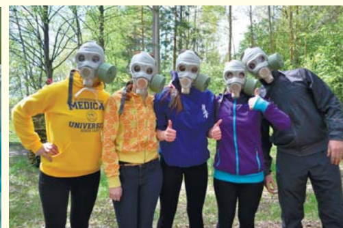
День здоровья на учебно-оздоровительной базе в Васкелово