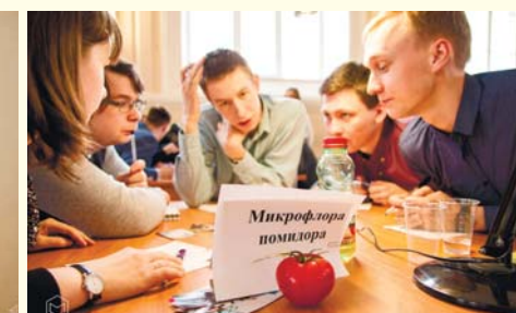
Чемпионат игры Что? Где? Когда?