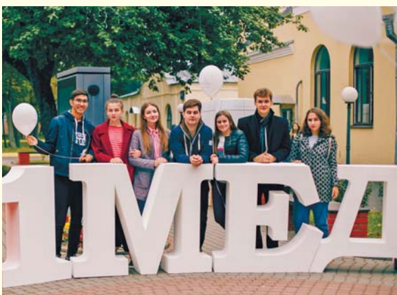
День рождения Университета

Совсем не обязательно быть членом какой-либо организации, чтобы иметь возможность проявить себя. Достаточно обладать желанием. Студенческие годы прекрасны: это время веселых историй, удивительных открытий и ваших первых достижений.