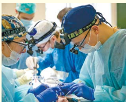
Участники олимпиады по хирургии