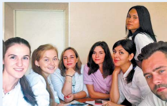
Выпускники отделения спортивной медицины, 2017 год

– Мы даем студенту все возможности, чтобы стать хорошим врачом. Кроме того, каждый может реализовать себя и в научной работе, в спорте, творчестве, общественной деятельности. В Университете работают замечательные педагоги, они всегда помогут в освоении профессии. И мы гордимся выпускниками, которые с честью несут славу Первого СПбГМУ им. акад. И.П. Павлова во всех уголках нашей страны, а также во многих странах мира.