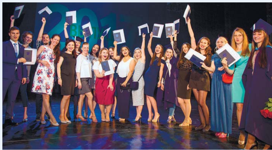
Выпускники педиатрического факультета, 2017 год

Производственная практика проходит на ведущих базах Университета – в ДГБ № 1 и НИИ детской онкологии, гематологии и трансплантологии имени Р.М. Горбачевой, перинатальном центре НМИЦ имени В.А. Алмазова. Выпускники педиатрического факультета могут продолжить свое обучение в клинической ординатуре и аспирантуре более чем по двадцати медицинским специальностям.