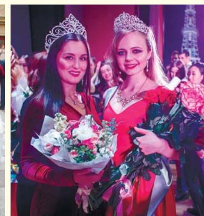
Конкурс красоты «Мисс Первый мед»