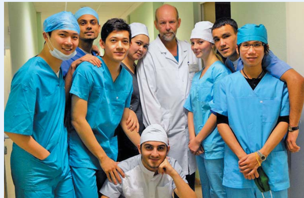
Выпускники медицинского факультета иностранных студентов, 2017 год

За все время существования Университета на его различных факультетах обучалось более 5 тысяч граждан других стран. В настоящее время обучение проходят студенты из 74 стран. В качестве структурного подразделения факультет существует с 1961 года. Осуществляются довузовская подготовка, додипломное образование (по специальностям «Лечебное дело», «Стоматология», «Педиатрия»), различные формы последипломного и дополнительного образования, включая клиническую ординатуру, аспирантуру и докторантуру. На факультете организовано сопровождение студентов в вопросах, связанных с размещением в общежитии, соблюдением режима пребывания в России, организацией досуга и внеучебной работы. В настоящее время многие иностранные выпускники работают в США, Канаде, странах Европы, Африки и Азии. Некоторые являются ведущими специалистами в своей области.