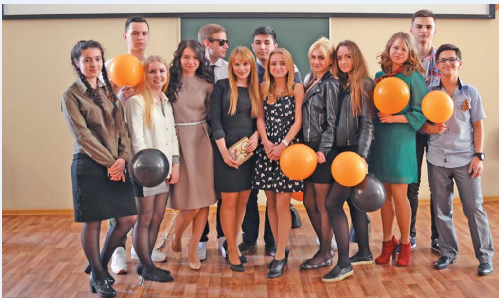
Выпускники института сестринского образования, 2016 год