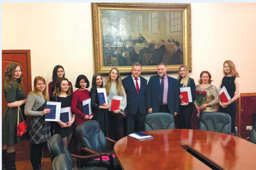
Выпускники отделения клинической психологии в день получения дипломов, 2018 год

– Возможности медицинского Университета для подготовки клинического психолога оптимальны. Сочетание глубоких знаний психологии и медицины сделает наших выпускников уникальными и очень востребованными специалистами.