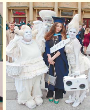
Выпуск врачей 2017 года