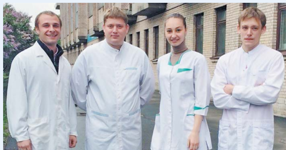
Выпускники факультета адаптивной физической культуры, 2014 год

Основан в 2005 году. Осуществляет подготовку бакалавров по специальности «Физическая культура для лиц с отклонениями в состоянии здоровья (адаптивная физическая культура)». Форма обучения – заочная, продолжительность обучения – 5 лет. С третьего курса студенты овладевают знаниями по специализации «Физическая реабилитация». Производственная практика проходит на базе общеобразовательных учреждений, реабилитационных и медико-социальных центров, стационаров и поликлиник.