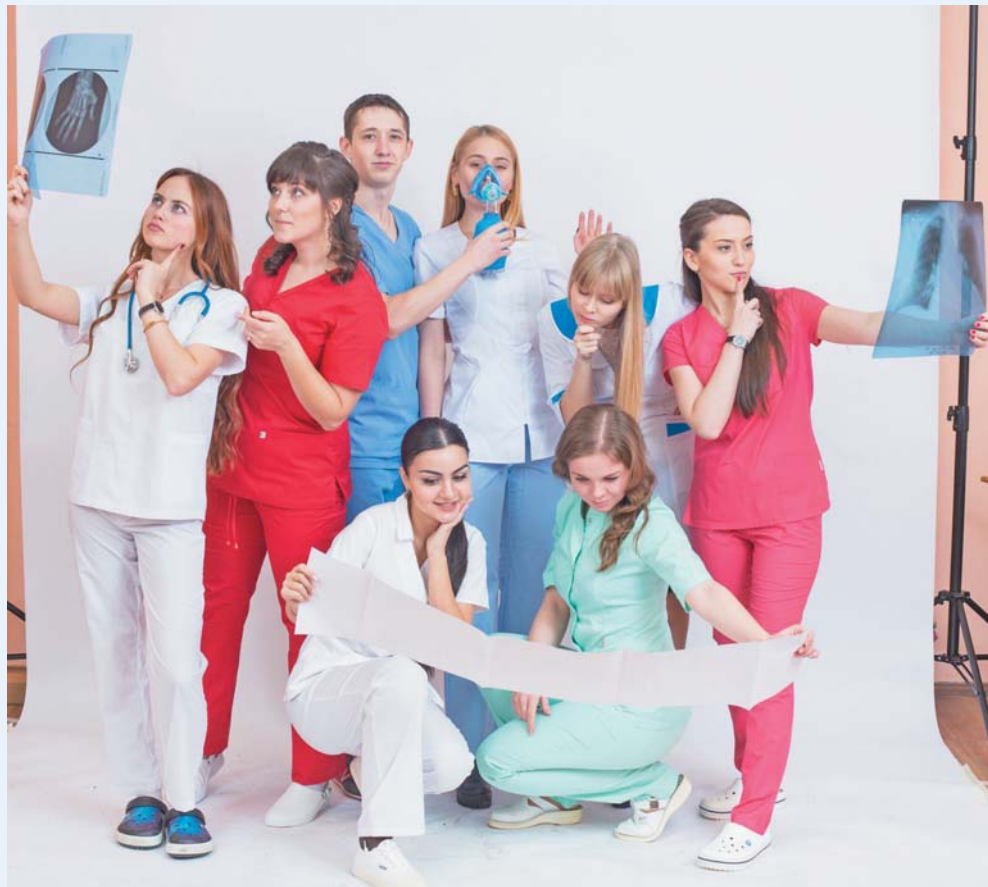
Выпускники лечебного факультета, 2017 год

Основан в 1897 году. Осуществляет подготовку врачей-лечебников по специальности «Лечебное дело». Среди особенностей учебного плана можно выделить глубокое изучение медико-биологических дисциплин и большой объем общеклинической подготовки студентов. На кафедрах факультета имеется более 200 учебных комнат, 39 научных и учебных лабораторий – учебных музеев; лекции читаются в 12 аудиториях, оборудованных современными видами наглядной демонстрации материала. Большая часть клинических практических занятий проводится на собственной клинической базе Университета (более 1500 коек), а также на базах поликлиник, крупных городских стационаров (многопрофильные больницы № 2, № 3 им. святой Великомученицы Елизаветы, № 4 им. святого Великомученика Георгия, № 17 – Александровская больница, инфекционная больница им. С.П. Боткина, детская больница № 1, инфекционная детская больница № 5 и др.), а также на базах различных научных центров (Национальный медицинский исследовательский центр им. В.А. Алмазова, Национальный медицинский исследовательский центр психиатрии и неврологии им. В.М. Бехтерева, Институт мозга человека РАН, Национальный медицинский исследовательский центр онкологии им. Н.Н. Петрова и др.).