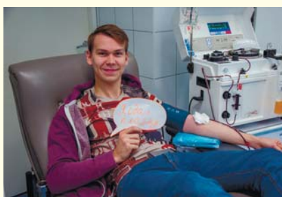
Общегородской День донора