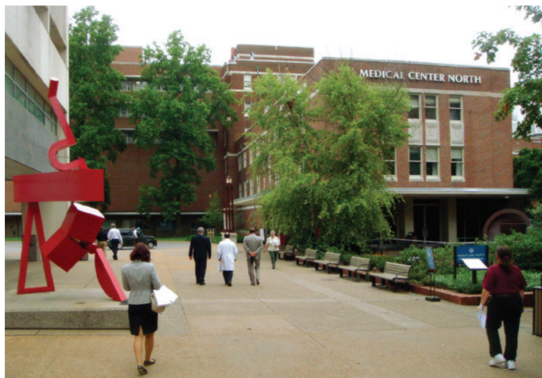
Территория университета Вандербилта