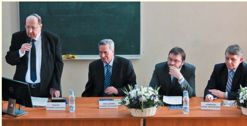
Открытие V научно-практической конференции урологов СЗФО с участием Европейской школы урологов