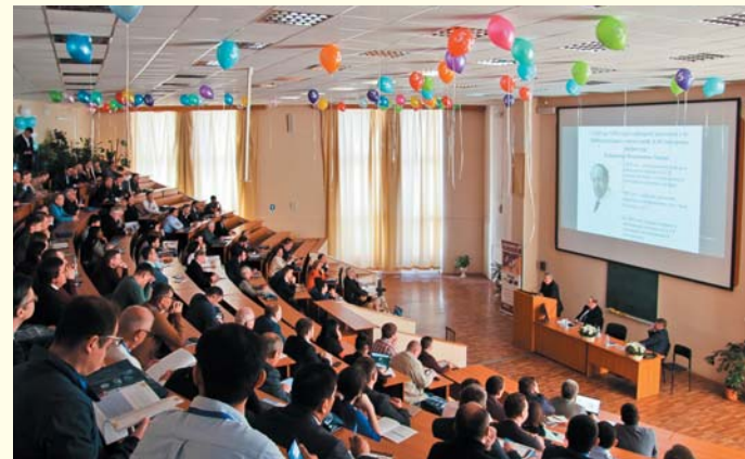
С докладом выступает профессор С.Х. Аль-Шукри

В работе приняли участие более 500 специалистов, что является весьма значительным показателем для урологических конференций. Еще большее число врачей смотрели трансляцию заседаний онлайн. География участников была чрезвычайно широкой: от Дальнего Востока до Калининграда. Многие также прибыли из-за рубежа. Например, делегация из Казахстана включала в себя 13 врачей.