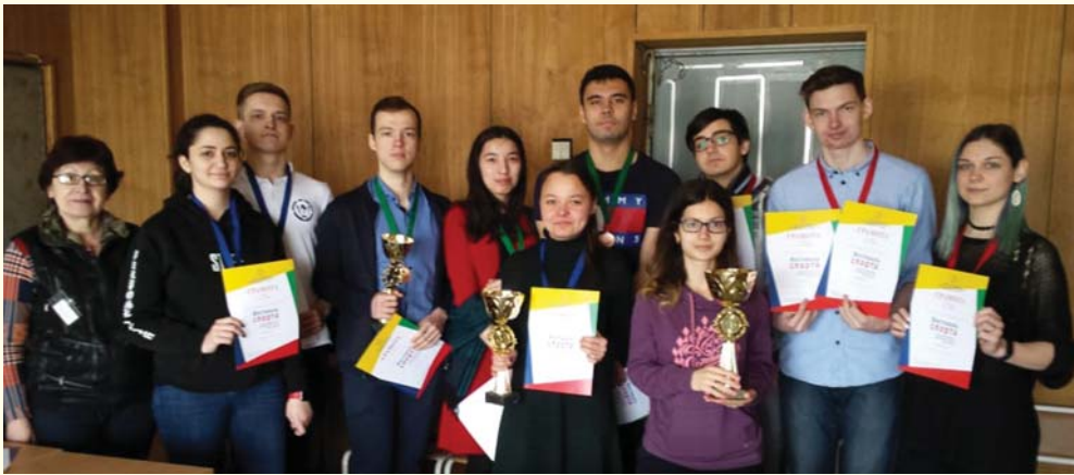
Шахматисты нашего Университета

Весенняя пора очень богата на спортивные соревнования, в которых принимал участие наш Университет. Расскажем по порядку о некоторых из них.