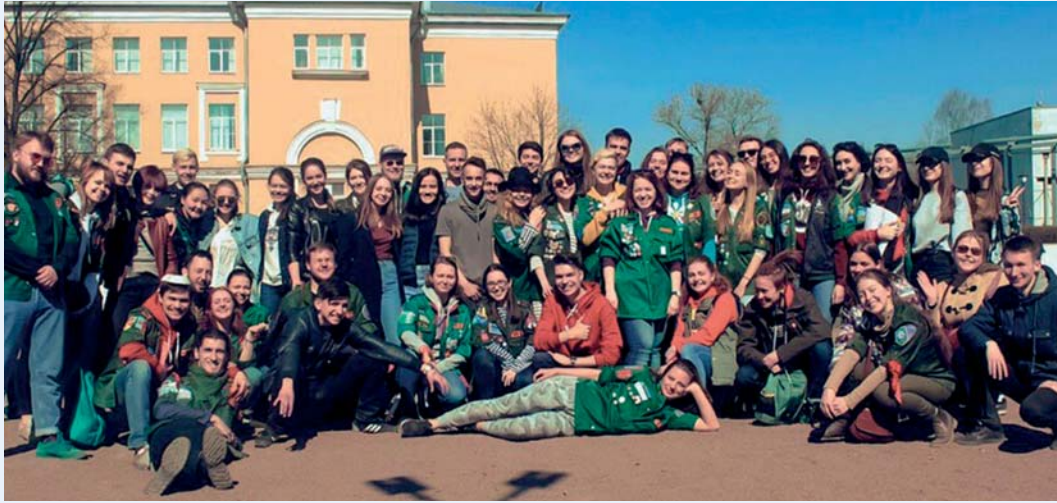
Участники и организаторы Медицинских игр

21 апреля на территории ПСПбГМУ состоялись становящиеся уже традиционными Медицинские игры, организованные силами Штаба студенческих отрядов Университета. Это станционная игра, придуманная бойцами студенческих отрядов для учащихся медицинских вузов города и кандидатов в отряды.