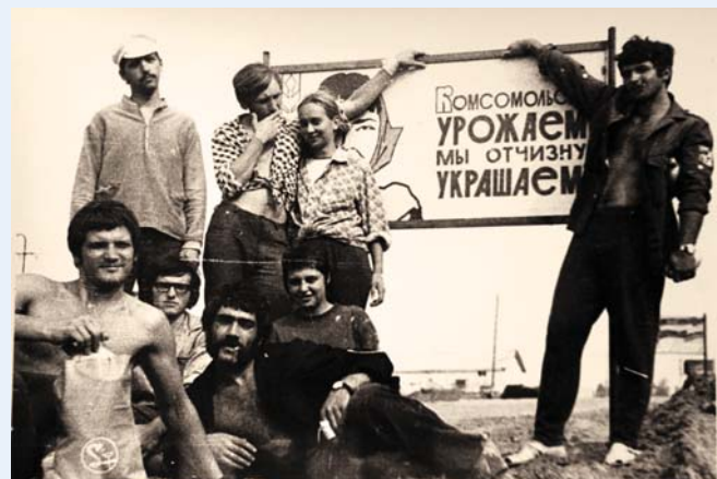
Строительный отряд 1 ЛМИ