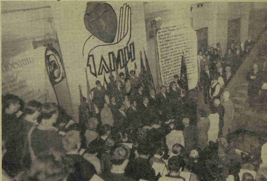
Седьмая аудитория. Праздник посвящения в студенты первокурсников.

На 13 сентября наши отряды убрали 44,5 га; стоматологи — 16, II курс — 11,5 и III — 17 гектаров.