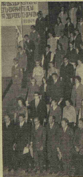
Звучат слова клятвы...