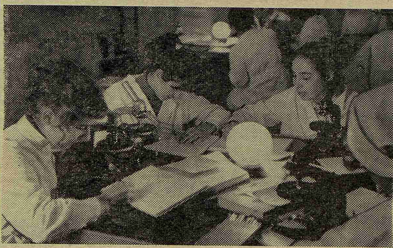
Месяц назад студенты III курса пришли на кафедру патологической анатомии. Весной — экзамен. А сегодня — упорные занятия. Осенний семестр труднее, именно сейчас изучаются общепатологические проблемы. В этом году для облегчения работы студентов значительно расширена иллюстративная часть курса: введены цветные диапозитивы с микроскопических препаратов, расширена демонстрация музейных макропрепаратов, что помогает студентам на диагностических занятиях.

И. ЗАОСТРОВЦЕВ преподаватель военной кафедры