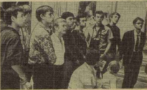
Фото и текст студента IV курса Я. НАКАТИСА