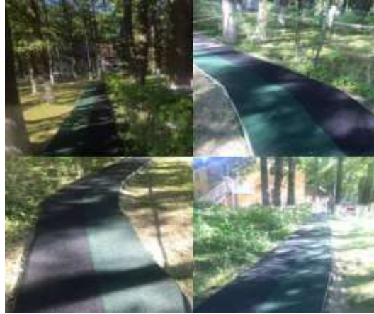
Дорожка со специальным покрытием в рамках программы "Доступная среда". 2019г.