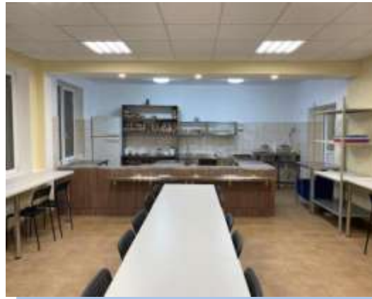
Отремонтированная столовая в стационаре. 2019г.