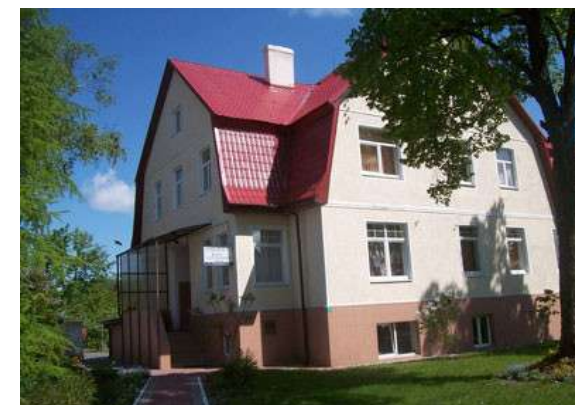
Отделение паллиативной помощи № 2