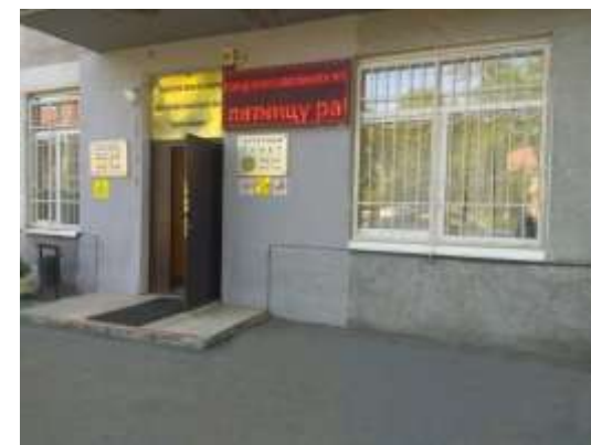
Поликлиническое отделение № 3

В июле 2019 года произошла реорганизация медицинских учреждений, путем присоединения к ГБУЗ «Городская больница № 2» ГБУЗ «Городская больница № 1» и ГБУЗ «Городской дом сестринского ухода».