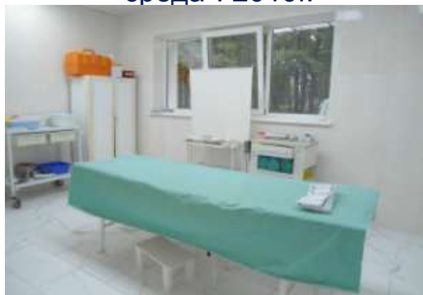
Отремонтированный кабинет врача-хирурга. 2019г.