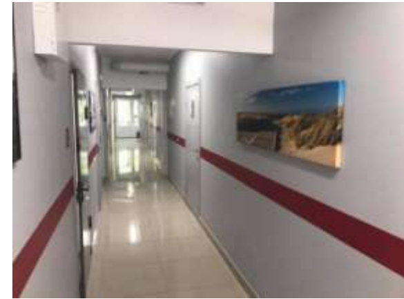
Отремонтированный коридор гериатрического отделения. 2018г.