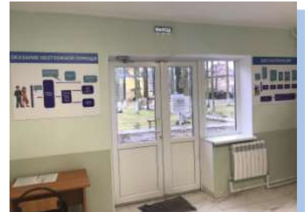
Холл регистратуры поликлинического отделения № 1. 2019г.