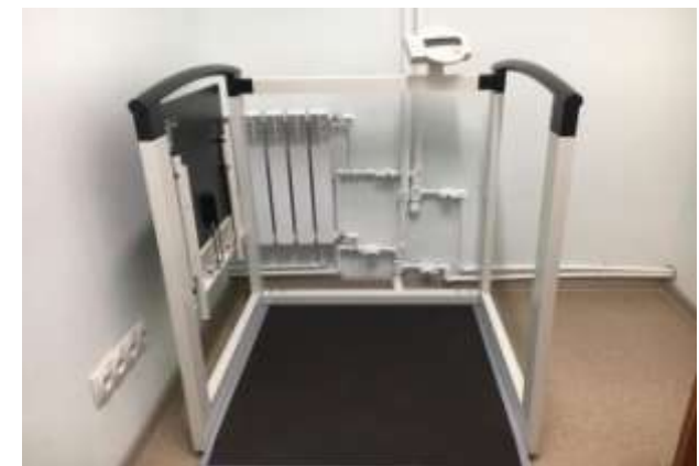
Специальные весы для гериатрического отделения. 2019г.