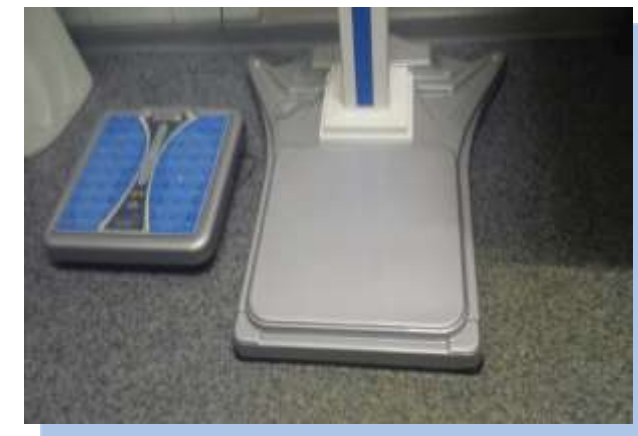
Оборудование для кабинета диспансеризации. 2019г.