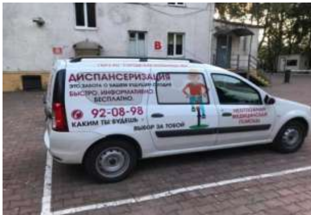
Приобретенный автомобиль для службы неотложной помощи. 2019г.