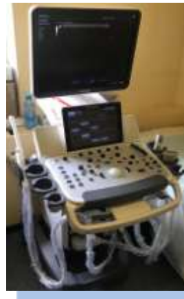
Приобретенный аппарат УЗИ и коляски для маломобильных групп населения. 2019г.