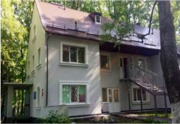
Поликлиническое отделение №1 Отремонтированный фасад здания. 2019г.