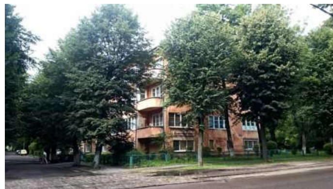
Поликлиническое отделение № 2