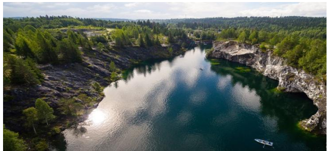
Горный Парк Рускеала