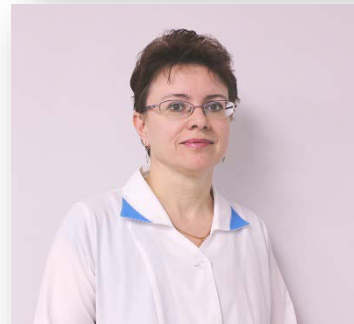
Заведующий терапевтическим отделением №3 –