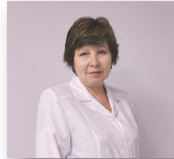
Заведующий терапевтическим отделением №2 –