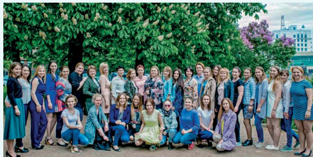
Выпускники Института сестринского образования