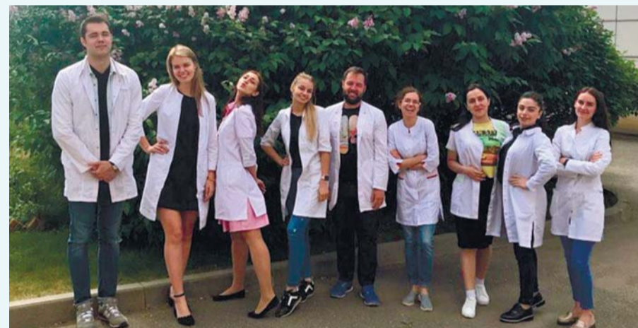
Выпускники педиатрического факультета, 2018 год

Производственная практика проходит на ведущих базах Университета – в ДГБ № 1 и НИИ детской онкологии, гематологии и трансплантологии имени Р.М. Горбачевой, перинатальном центре Северо-Западного федерального медицинского исследовательского центра имени В.А. Алмазова. Выпускники педиатрического факультета могут продолжить свое обучение в клинической ординатуре и аспирантуре более чем по двадцати медицинским специальностям.