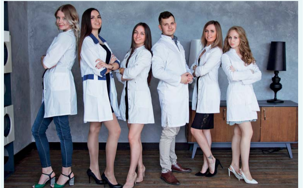
Выпускники стоматологического факультета, 2018 год

Практические занятия проводятся как на собственной клинической базе Университета (в том числе, на базе Научно-исследовательского института стоматологии и челюстно-лицевой хирургии – самого большого учебного стоматологического центра Северо-Западного региона России), так и на базах 30 городских государственных и негосударственных стоматологических ЛПУ.