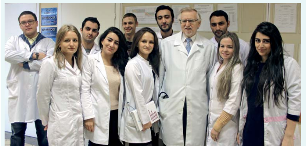
Выпускники медицинского факультета иностранных студентов, 2018 год

За более чем сто лет количество наших выпускников превысило 5 тысяч. Среди них – граждане Бразилии, Великобритании, Швеции, Финляндии, Греции, Израиля, Индии, Ирана, Канады, КНР, Кувейта, Ливана, Марокко, США и других стран. Высокое качество обучения дает им возможность добиваться хороших результатов в профессии.