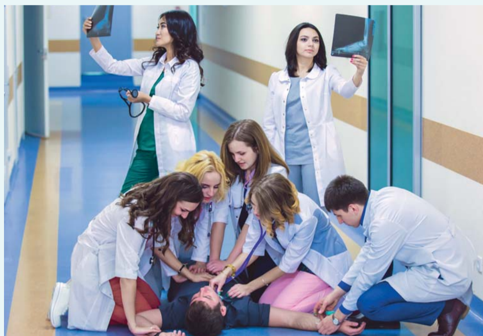
Выпускники лечебного факультета, 2018 год

Вы находитесь на пороге одного из самых важных решений в своей жизни, первого выбора во взрослой жизни – выбора профессии! Врач – это не только специальность. Это выбор жизненного пути, круга друзей и, нередко, будущей семьи. Решение связать себя с медициной – очень ответственный шаг. С момента поступления в медицинский вуз для вас закончится детство, и вы навсегда погрузитесь в сложный, но волшебный мир науки и служения здоровью людей. Вас ждут прекрасные аудитории, в которых будут читать лекции звезды мирового уровня, в том числе и Нобелевские лауреаты; десятки зарубежных стран для прохождения стажировок, научно-исследовательские центры Университета для научной работы, учебные лаборатории и университетские музеи; чистая и просторная столовая; спортивный комплекс с бассейном и, конечно, богатейшие клиники вуза, оснащенные самым современным оборудованием. Институты и центры, входящие в состав Университета, предоставят вам возможность увидеть самые передовые операции в исполнении лидеров хирургии нашей страны, принять участие в обходах академиков-терапевтов, хирургов и неврологов. Более 200 клинических баз для практики, стоматологический комплекс на 2000 квадратных метров, 38 гектаров зеленой территории... Все это будет вашим домом: для кого-то на пять-шесть лет, а для самых лучших – на всю жизнь!