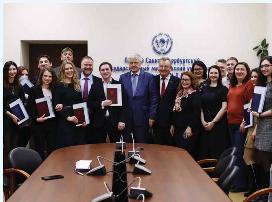
Выпускники отделения клинической психологии, 2020 год

– Возможности медицинского Университета для подготовки клинического психолога оптимальны. Сочетание глубоких знаний психологии и медицины делает наших выпускников уникальными и очень востребованными специалистами.