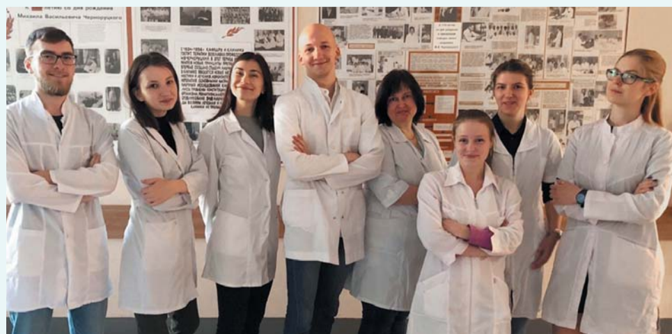
Выпускники отделения спортивной медицины, 2018 год

Основано в 1991 году. Осуществляет подготовку врачей по специальности «Лечебное дело». С 3 курса студенты овладевают знаниями по лечебной физической культуре, спортивной медицине, медицинскому массажу, физиотерапии. Специализированные предметы изучаются на базах врачебно-физкультурных диспансеров, научно-исследовательских институтов.