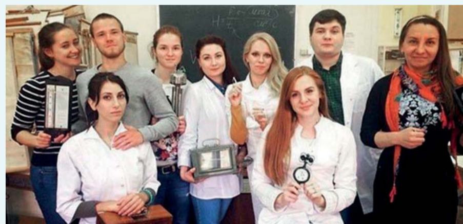
Выпускники отделения адаптивной физической культуры, 2018 год

Основано в 2005 году. Осуществляет подготовку бакалавров по специальности «Физическая культура для лиц с отклонениями в состоянии здоровья (адаптивная физическая культура)». Форма обучения – заочная, продолжительность обучения – 5 лет. С третьего курса студенты овладевают знаниями по специализации «Физическая реабилитация». Производственная практика проходит на базе общеобразовательных учреждений, реабилитационных и медико-социальных центров, стационаров и поликлиник.